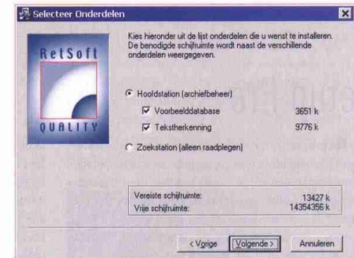
Abbeelding 2 Er zijn twee installatie-onderdelen

De functies van Retsoft Scan & Sorteert zijn nog wat uitgebreider dan hier beschreven. Als het pakket je wat lijkt kan je ook een demoversie downloaden vanaf de website om het programma een maand te proberen. Kijk dan ook meteen even naar de verschillende uitvoeringen en prijzen van Scan & Sorteert om de juiste keuze te kunnen maken. In ieder geval is het een heel bruikbaar en betaalbaar programma om de papieren documenten binnen je